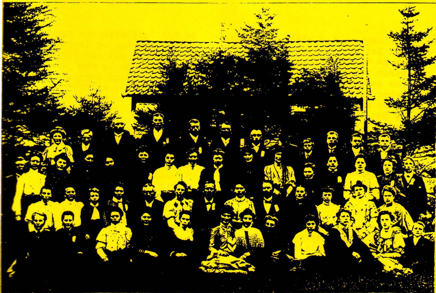
Stjernø Ungdomsforening 1907.