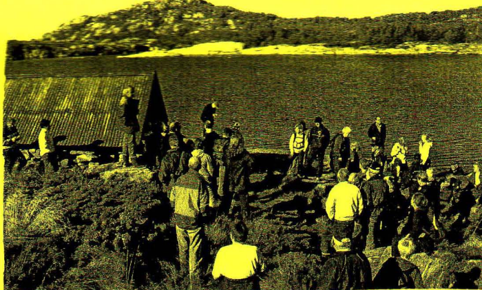
Framote ved slyhåla